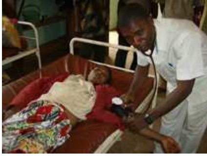
Hôpital de Bokonzi jumelé avec l'hôpital ZOL (Ziekenhuis Oost-Limburg)

Bokonzi est une zone de santé située dans la province de l'Equateur. Sa superficie totale est de 7 200 km 2 et la zone compte 200.000 habitants.