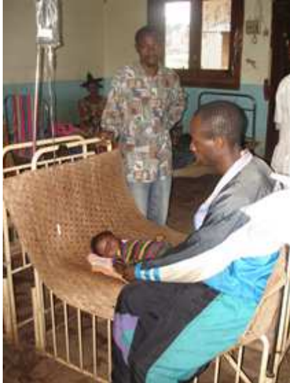
Hôpital de Bangabola jumelé avec l'hôpital AZ Maria-Middelares de Sint-Niklaas

Bangabola est une zone de santé située dans la province de l'Equateur, au nord-ouest de la R.D. Congo. Sa superficie est de 5 543 km 2 et elle compte 99 340 habitants.